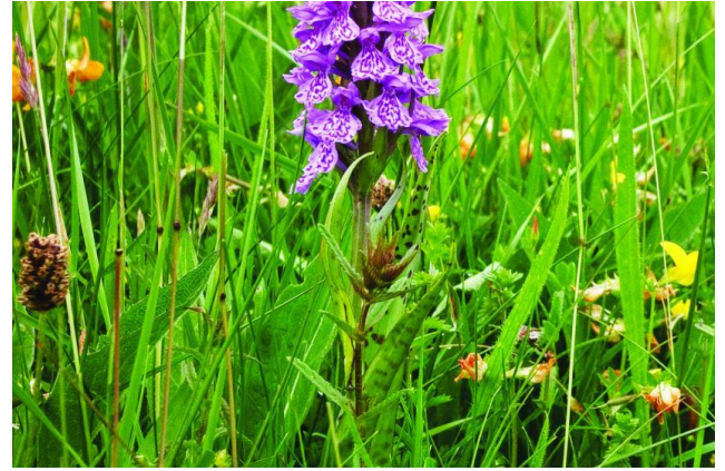
Caeau Tan y Bwlch