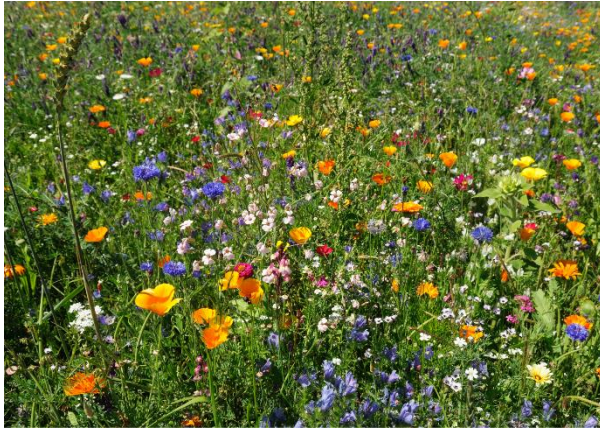
Gweirglodd darluniadol